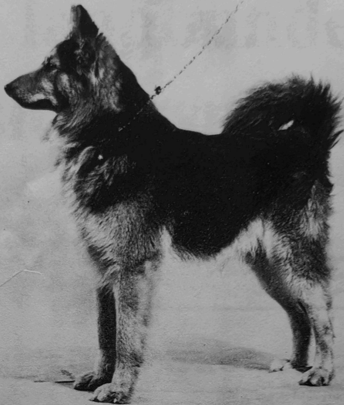
LAPSK VALLHUND visades i detta enda exemplar utom tävlan. Den är en produkt av en lokal stam spetshundar som nu är föremål för renodling med sikte på ett framtida erkännande som självständig ras.

Springer spaniel: Ambridge Bystander of Stubham, M. Hermelin, cert, cacib,