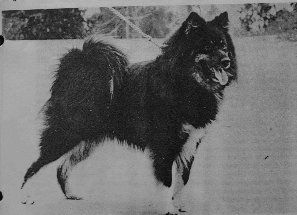
Bilden ovan: En långhårig renhund med ljusa tecken. Undre bilden: En korthårig renhund. De korthåriga renhundarna var av betydligt bättre kvalitet än de långhåriga på utställningen.